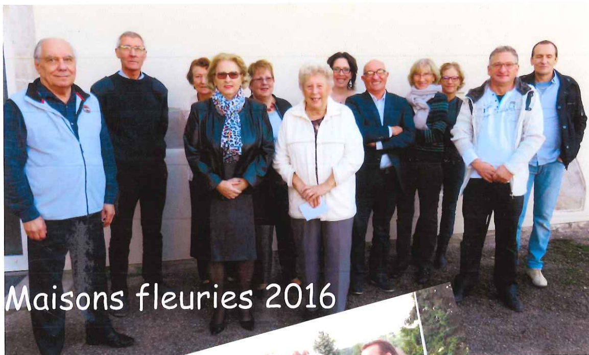
Maisons fleuries 2016