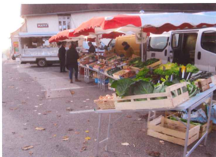
La préparation du marché du vendredi soir avec la fromagère de Recologne, le primeur de Marnay et l'apiculteur de Thervay.