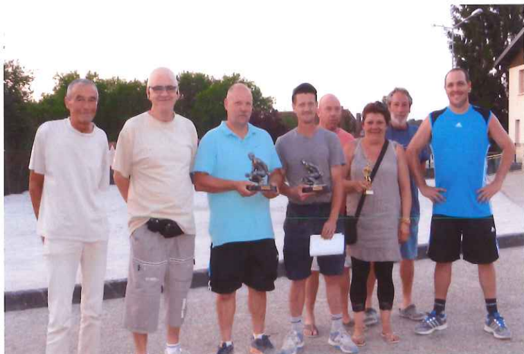
Les lauréats de la pétanque 2015