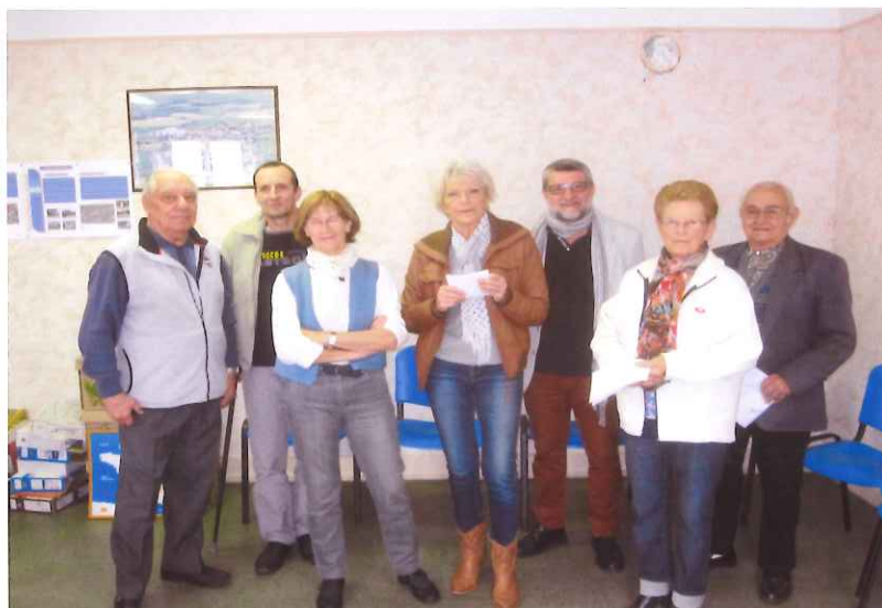
Les lauréats des maisons fleuries 2015